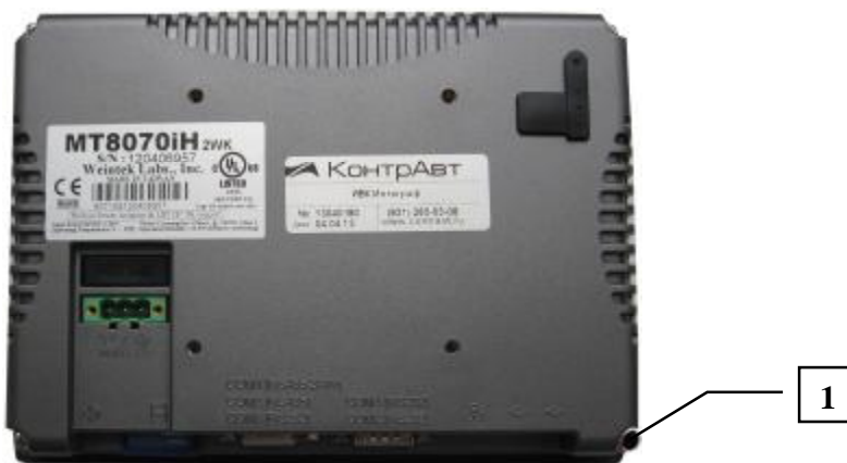
Рисунок 2 – Защита панели оператора ИБК ИНТЕГРАФ от несанкционированного вскрытия с помощью поверительного клейма

Для предотвращения несанкционированного доступа к ИБК ИНТЕГРАФ на корпусе электронного шкафа предусмотрен концевой выключатель. Принцип его действия состоит в том что, при вскрытии корпуса в протокол событий добавляется соответствующая запись.