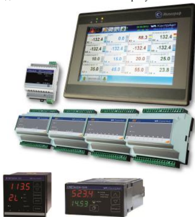
Рисунок 1- Общий вид ИВК ИНТЕГРАФ

Внешний вид ИВК ИНТЕГРАФ показан на рисунке 1.